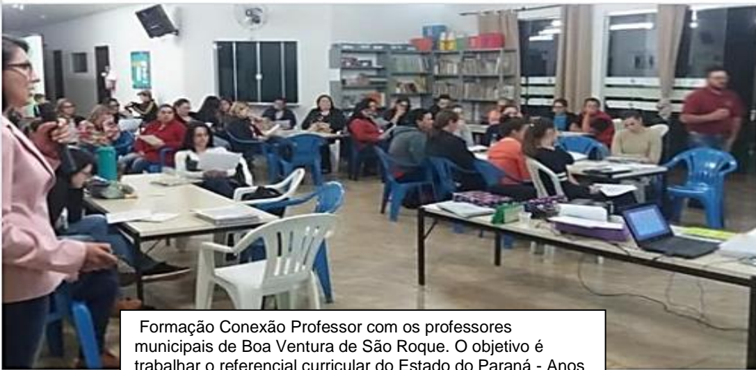
Formação Conexão Professor com os professores municipais de Boa Ventura de São Roque. O objetivo é trabalhar o referencial curricular do Estado do Paraná - Anos Iniciais, realizando a integração entre as disciplinas.