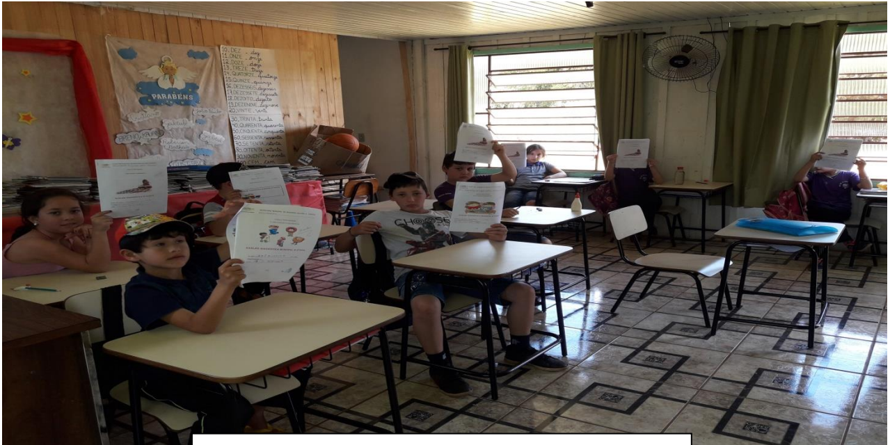
Análise Diagnóstica Municipal (ADM) 2019