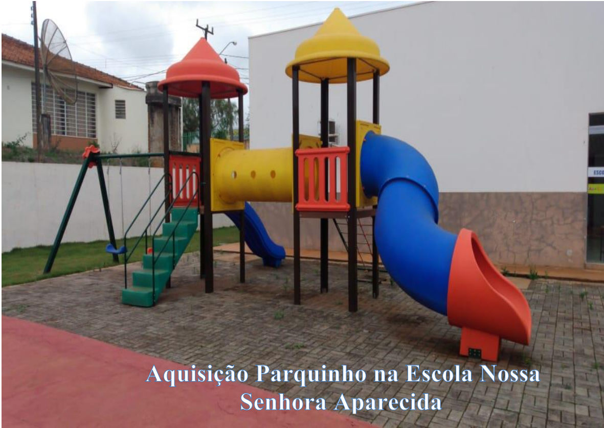
Aquisição Parquinho na Escola Nossa Senhora Aparecida