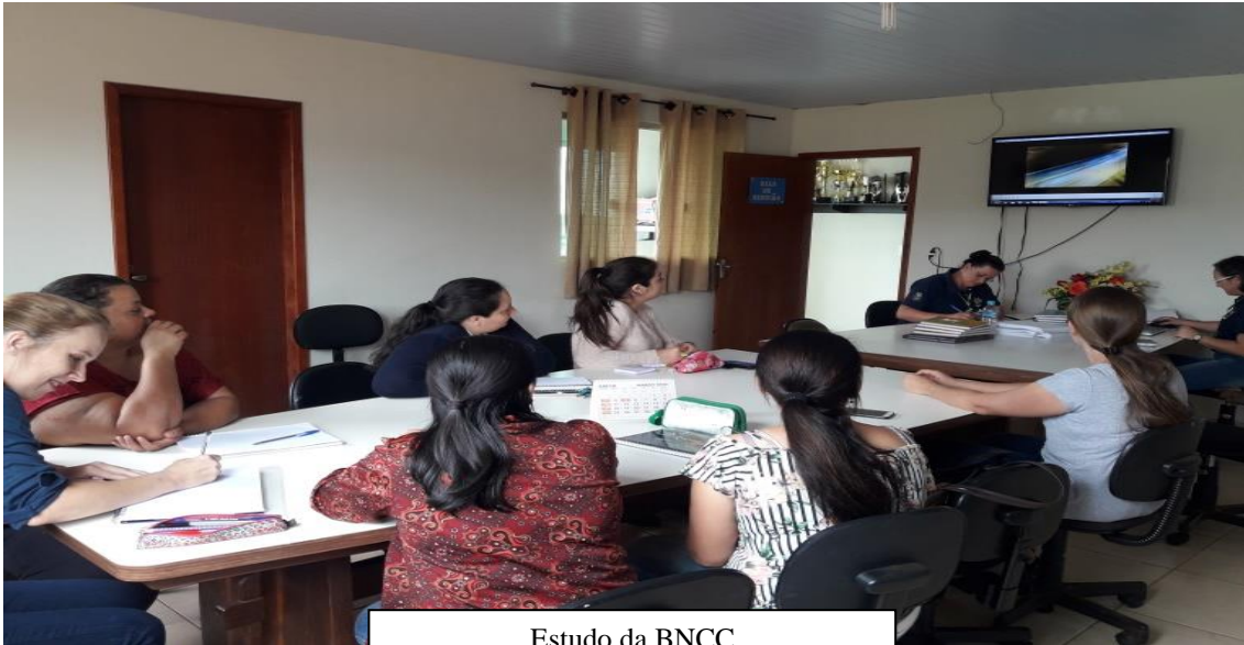
Estudo da BNCC