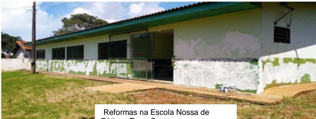
Reformas na Escola Nossa de Fátima- Terra Santa