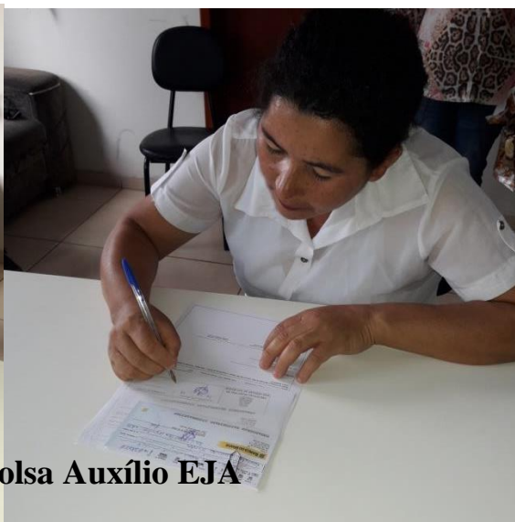
Projeto Bolsa Auxílio EJA