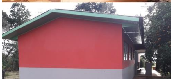
Reforma e campo de areia na escola Dom Frederico Helmelt